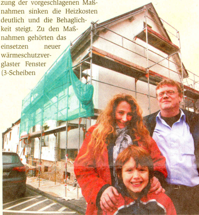
Familie Weidauer vor ihrem Haus.

Informationen: GIESSENER-GEBÄUDEPASS für Stadt und Landkreis Gießen, www.giessener-gebäudepass.de , Umwelttelefon: 0641-3062113 (Umweltamt der Universitätsstadt Gießen).