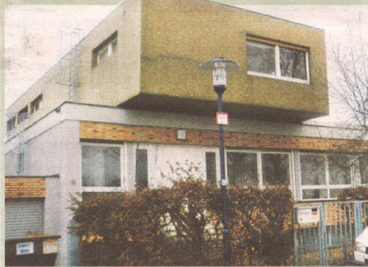
Auch dieses Gebäude kann energetisch optimal saniert werden!

Weitere Informationen auch zur Energie-Effizienzberatung von Unternehmen (KMUs) GIESSENER-GEBÄUDEPASS für Stadt und Landkreis Gießen, www.giessener-gebäudepass.de , Umwelttelefon 0641-3062113 (Umweltamt der Stadt Gießen).