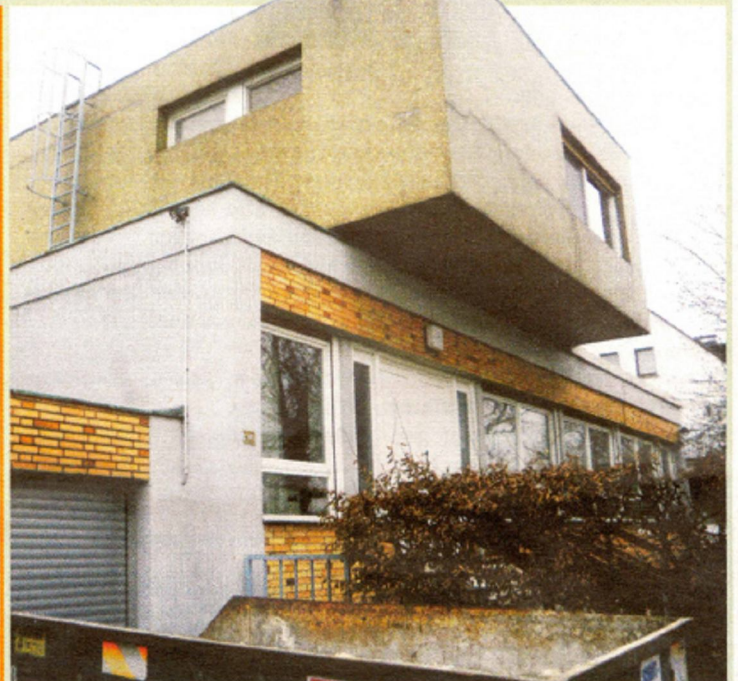
Der Bungalow aus den 60ern hat besondere „Problemzonen“.